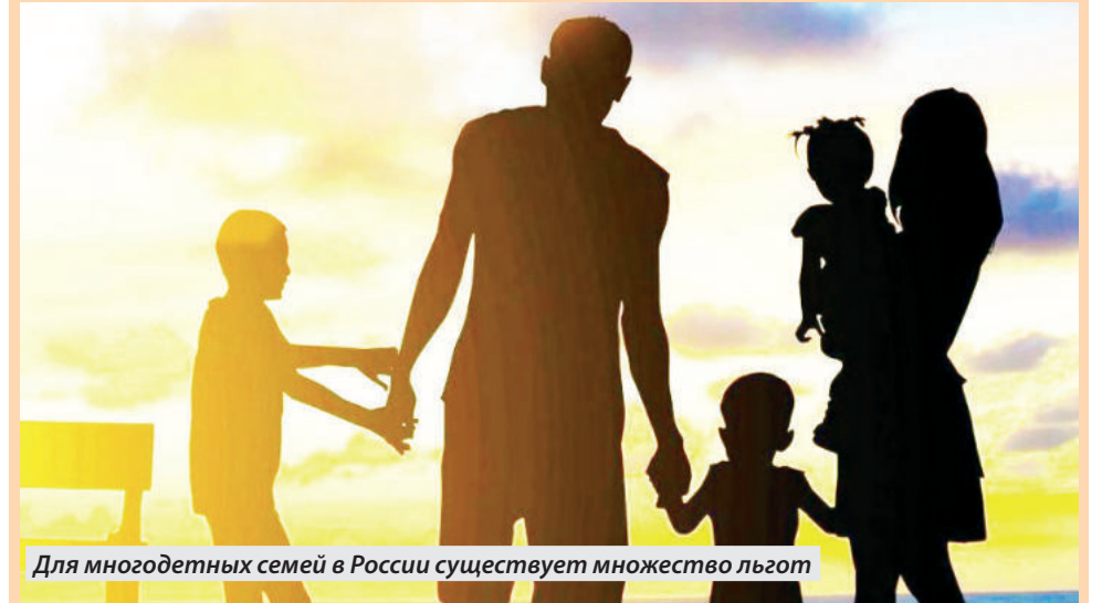
Для многодетных семей в России существует множество льгот

В рамках реализации партийного проекта «Крепкая семья» и проведения Года семьи в республике уделяется большое внимание социальной поддержке многодетных семей. В ДНР проживает 9,6 тысяч многодетных семей, в которых воспитываются более 32 тысяч детей.