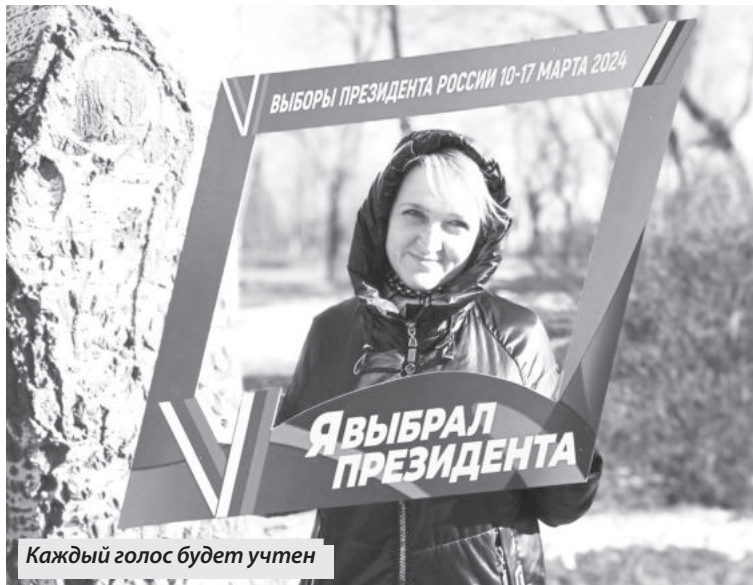
Каждый голос будет учтен

ЖИТЕЛИ ГОРОДА СМОГЛИ СДЕЛАТЬ СВОЙ ВЫБОР ПРЯМО НА ПРИДОМОВЫХ ТЕРРИТОРИЯХ