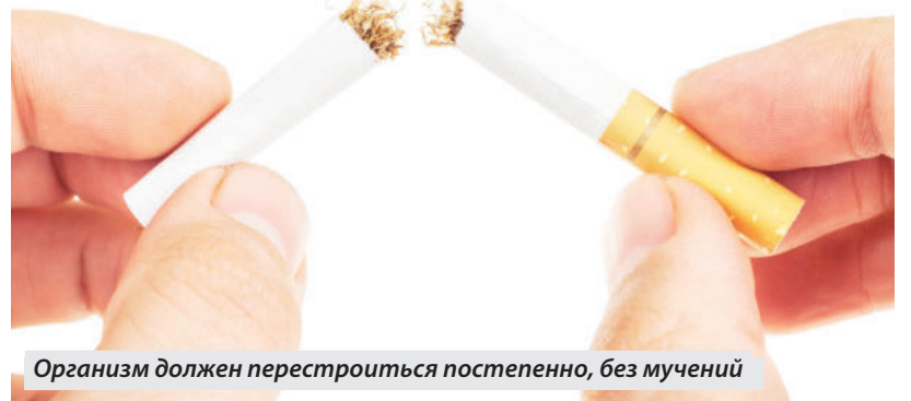
Организм должен перестроиться постепенно, без мучений

Сколько времени займет постепенный отказ? Точная длительность всегда определяется в индивидуальном порядке. При слабой привязанности и наличии силы