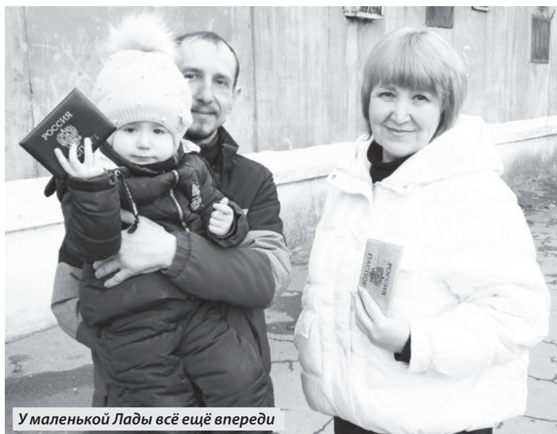
У маленькой Лады всё ещё впереди

Мы хотим стабильности, чтобы была достойная зарплата, чтобы цены не росли, медицина и образование