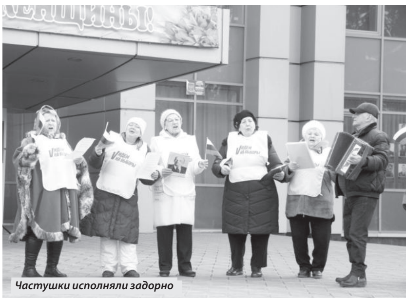
Частушки исполняли задорно

Сами зрители делились своими эмоциями от мероприятия и ожиданиями от предстоящего политического события. «Я очень рада, что мы будем выбирать президента, что мы снова одна большая семья. Обязательно победим и у наших детей будет большое будущее. Еще в своем советском 7 классе, после того как я узнала