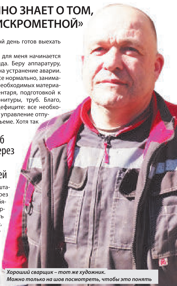
Хороший сварщик – тот же художник. Можно только на шов посмотреть, чтобы это понять

После этих слов я на несколько секунд потерял нить разговора. И вдруг подумалось: что произойдет в жизни людей, живущих в этих 83 домах, если завтра какая-нибудь распиаренная певичка ртом, вдруг потеряет голос? Или популярный