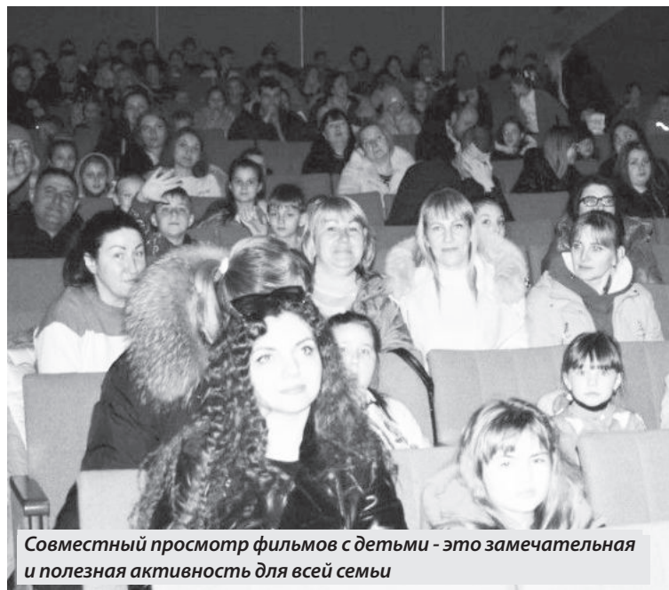
Совместный просмотр фильмов с детьми - это замечательная и полезная активность для всей семьи

ВСЕ ЖЕЛАЮЩИЕ СМОГЛИ ПОСЕТИТЬ БЕСПЛАТНЫЕ КИНОСЕАНСЫ