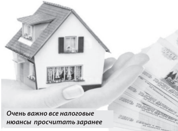
Очень важно все налоговые нюансы просчитать заранее

Физические лица, получившие доход от продажи, обязаны самостоятельно исчислить сумму налога на доходы физических лиц, представить декларацию по форме 3-НДФЛ и уплатить налог в установленные сроки.