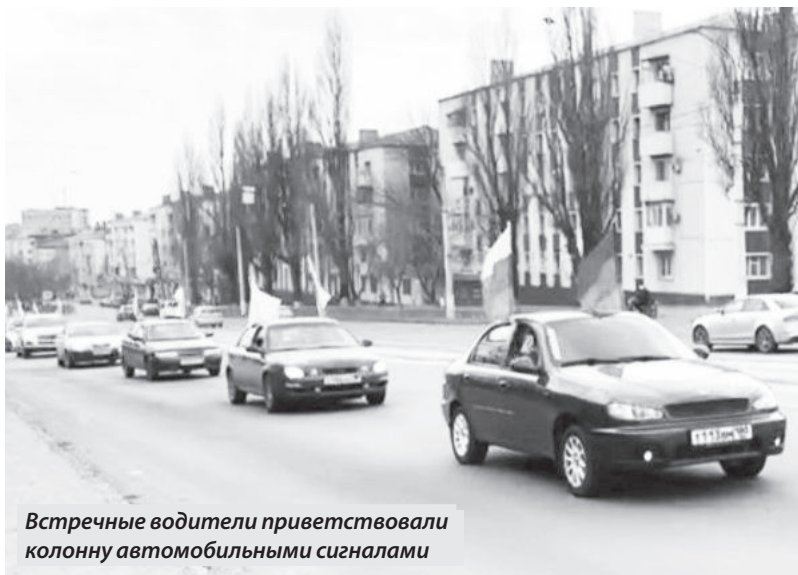
Встречные водители приветствовали колонну автомобильными сигналами

Целью пробега было привлечь внимание обычных горожан, которые не особо интересуются политикой, к выборам президента России.