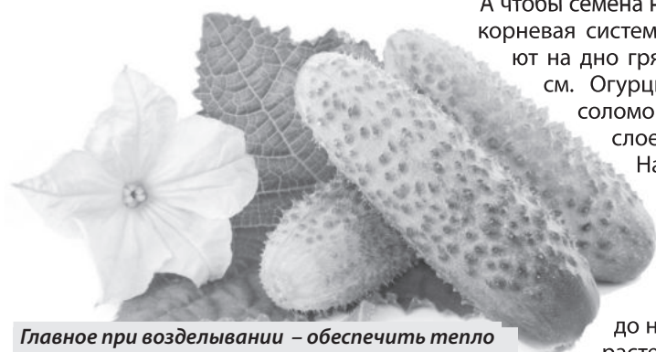
Главное при возделывании – обеспечить тепло и свободный доступ кислорода к корням

Если в начале роста всходов длительное время идут дожди или вы часто поливаете растения, у большинства сортов начинаются мощный рост плетей и образование мужских цветков, которые в народе и называют пустоцветом. То же самое бывает при загущении растений. Если появился пустоцвет, постарайтесь не поливать огурцы несколько дней подряд. А если растения привянут, сбрызните их сверху водой, но не напавайте досыта.