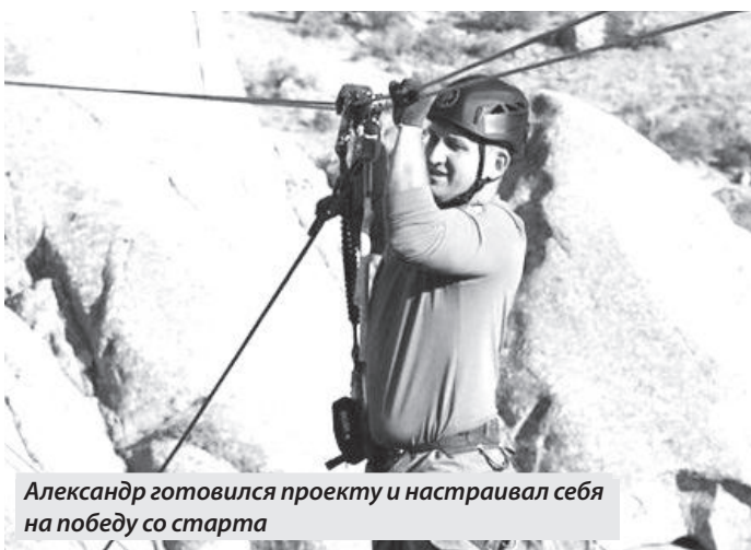
Александр готовился проекту и настраивал себя на победу со старта

35-летний цирковой тренер считает, что его победа как «народника» замотивирует тех, кто так и не решался выйти из зоны комфорта.