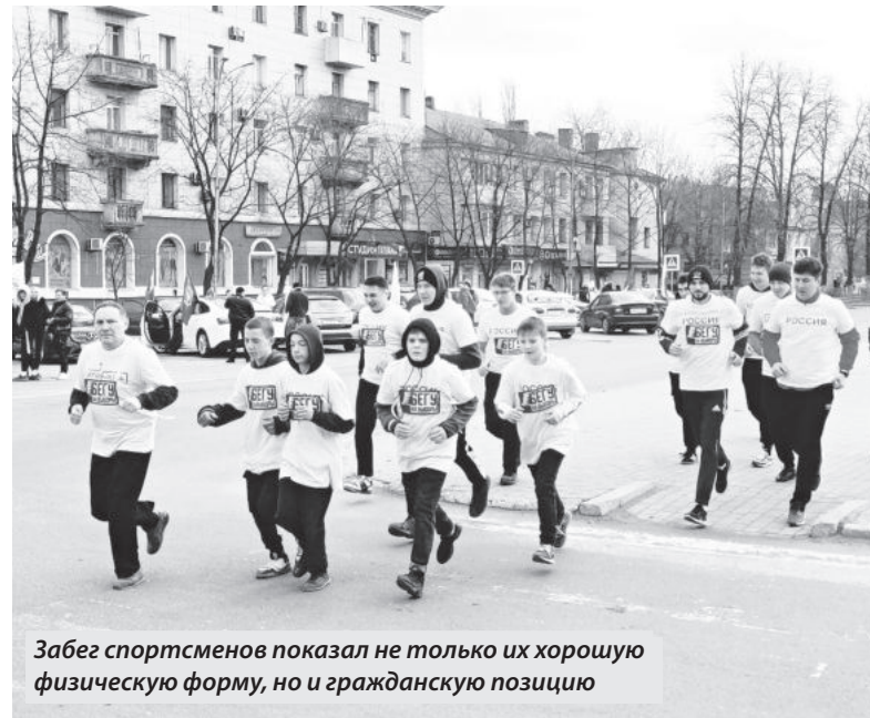
Забег спортсменов показал не только их хорошую физическую форму, но и гражданскую позицию

Тридцать спортсменов разделились на две возрастные группы: старший состав, лидеры, бежали 3,5 км, младший – 1,7 км. Также была проведена эстафета «Бегу, дрифтую и качу на выборы». Примечательно, что забег и эстафета прошли в этот день во многих городах Донецкой Народной Республики.