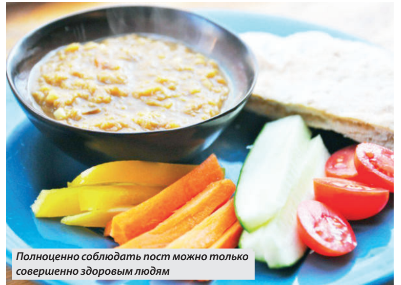
Полноценно соблюдать пост можно только совершенно здоровым людям

Великий пост — самый длительный и строгий из всех православных: он длится семь недель, отдавая дань многодневному посту Иисуса Христа в пустыне. В 2024 году Великий пост начинается 18 марта и заканчивается 4 мая.