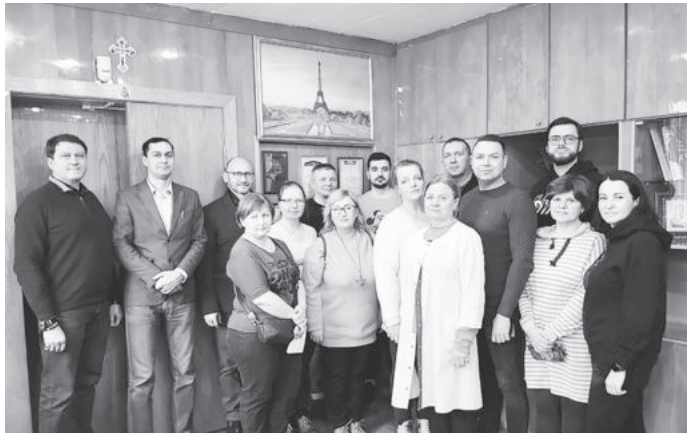
Чтобы работать комплексно и максимально эффективно, в подшефные больницы едут целыми бригадами

В состав бригады вошли терапевты и педиатры, травматолог, лор, окулист, патологоанатом, гастроэнтеролог, акушер-гинеколог, хирург и невролог.