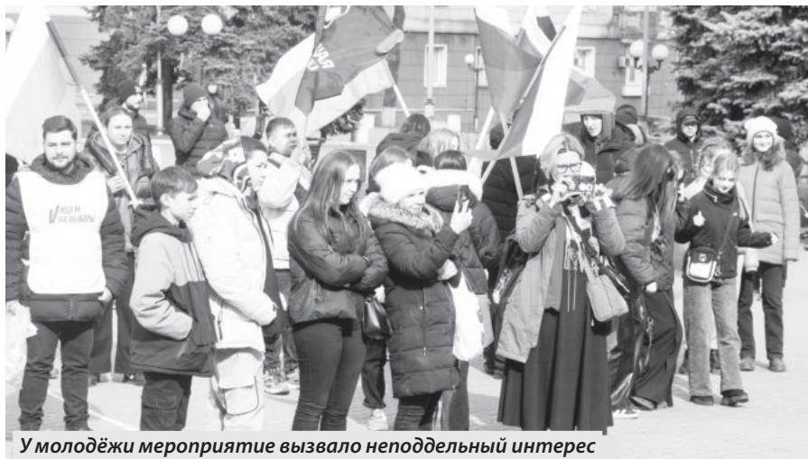
У молодёжи мероприятие вызвало неподдельный интерес

ВОЛОНТЕРЫ ПРИЗВАЛИ ГОРОЖАН ПРИНЯТЬ УЧАСТИЕ В ИСТОРИЧЕСКОМ ГОЛОСОВАНИИ