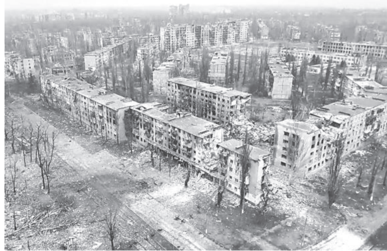
Задача – как можно быстрее восстановить город

«А еще люди интересовались, как они могут проголосовать на выборах Президента России. Мы создали все необходимые возможности, чтобы жители Авдеевки могли реа-