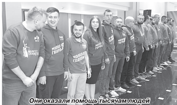
Они оказали помощь тысячам людей

Награждение проводил секретарь генерального совета партии «Единая Россия», первый заместитель председателя Совета Федерации Федерального Собрания Российской Федерации Андрей Турчак. Участие в церемонии по видеосвязи принял Глава ДНР Денис Пушилин.