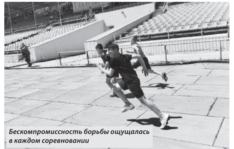
Бескомпромиссность борьбы ощущалась в каждом соревновании

Победители и призеры были награждены грамотами и медалями.