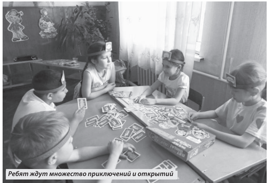
Ребята ждут множество приключений и открытий

4 июня 2024 года в пришкольных лагерях нашего города прошли мероприятия «По страницам сказок Пушкина» и поэтический марафон «Пусть Пушкин в каждом сердце отзовется», которые были посвящены юбилею великого русского поэта. Дети вспомнили сказки и стихотворения Пушкина, приняли