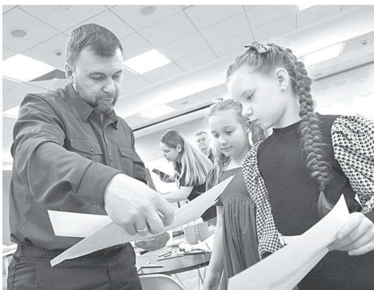
Глава ДНР знакомится с работами конкурсантов

Талантов у нас хватает: только в этом году уже 31 тысяча детей поучаствовали в разных конкурсах, состязаниях. И все везде показывают очень хороший результат. Но мы на этом не остановимся, будем развиваться дальше», – сказал Денис Пушилин и вручил подарки победительницам творческого конкурса.