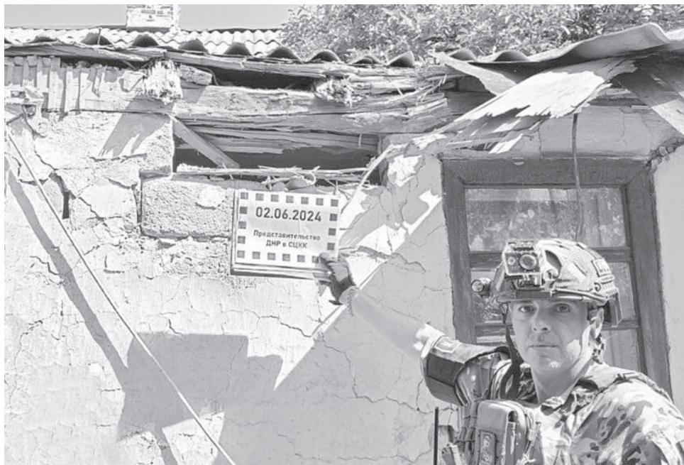
Поврежденный обстрелом жилой дом в Макеевке

«Заявления ряда западных стран, в том числе Соединенных Штатов Америки, не более чем легализация уже ранее применяемого западного вооружения по российским территориям, в том числе и по Белгородской области. Мы же видим, что такие