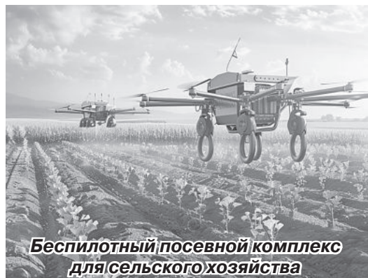
Беспилотный посевной комплекс для сельского хозяйства

В ДНР планируют применять беспилотные летательные аппараты в аграрной сфере. Об этом «Донецкому времени» рассказал и. о. заместителя председателя Правительства ДНР, министр агропромышленной политики и продовольствия Артем Крамаренко.