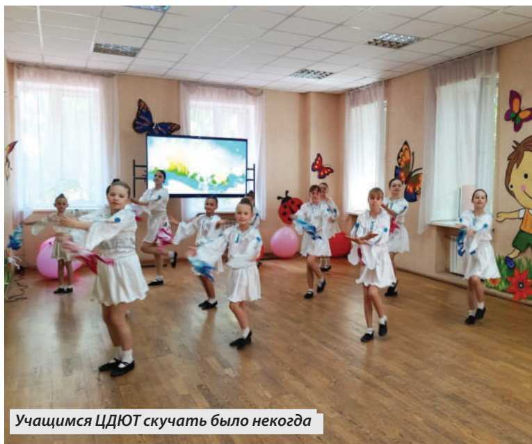
Учащиеся ЦДЮТ скучать было некогда

Международный день защиты детей – один из самых теплых и светлых праздников. Дата 1 июня, служит напоминанием об огромной ответственности за жизнь и здоровье каждого ребенка, которые особенно актуальны там, где грохочет война.