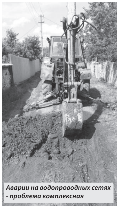
Аварии на водопроводных сетях - проблема комплексная

Прорывы канализационных и водопроводных сетей по-прежнему являются одной из главных проблем неудовлетворительной работы ЖКХ. Причем эта проблема не только нашего города. Многочисленные жалобы енакиевцев на текущие реки сточных вод в различных частях города говорят о том, что подходить к устранению аварий нужно комплексно. Латание дыр, замена заглушек и установка хомутов, лишь временная мера.