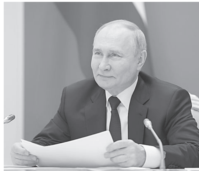
Президент России поздравляет донецкую семью с Днем защиты детей

Звание «Мать-героиня» присваивается женщинам, родившим и воспитавшим десять и более детей. Удостоенным звания также вручается знак особого отличия – орден «Мать-героиня». Звание и орден учреждены Указом Президента РФ в 2022 году.