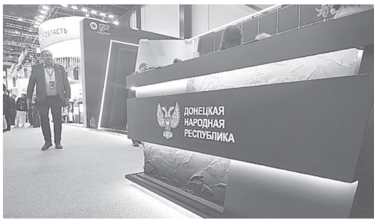
Стенд Республики расположен на площади в 95 кв. м

5 июня в северной столице России стартовал Петербургский международный экономический форум (ПМЭФ). Донецкая Народная Республика представила на нем свою площадку.