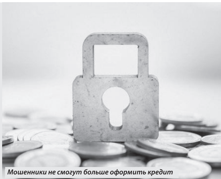
Мошенники не смогут больше оформить кредит

Информация подготовлена прокуратурой Донецкой Народной Республики