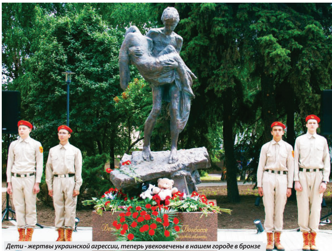
Дети - жертвы украинской агрессии, теперь увековечены в нашем городе в бронзе

30 МАЯ ТОРЖЕСТВЕННО ОТКРЫЛИ ПАМЯТНИК ДЕТЯМ-ЖЕРТВАМ ВОЙНЫ НА ДОНБАССЕ