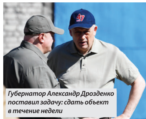
Губернатор Александр Дрозденко поставил задачу: сдать объект в течение недели

- Честно скажу, ребята, хуже всего, когда у нас слова расходятся с делом. Мы же все гарантируем. Мы еще никого здесь в этом плане не подвели. Не очень удобно, потому что я уже сказал, что в мой приезд в Енакиево запускаем МФЦ. Как это происхо-