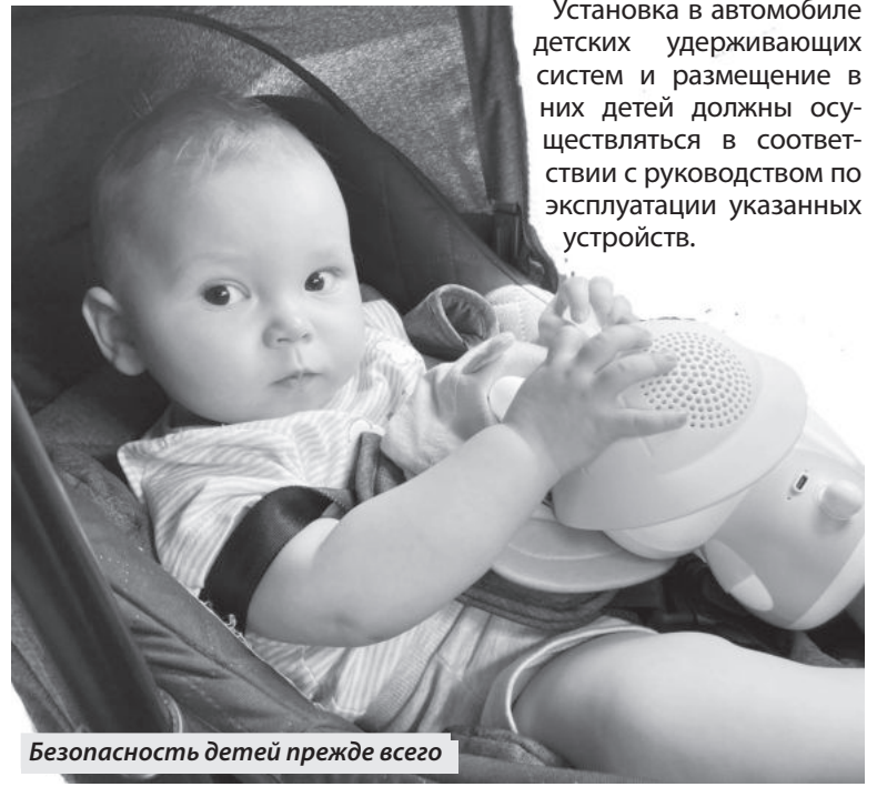
Безопасность детей прежде всего

Установка в автомобиле детских удерживающих систем и размещение в них детей должны осуществляться в соответствии с руководством по эксплуатации указанных устройств.