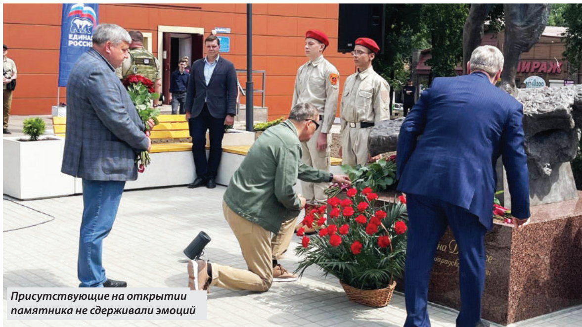
Присутствующие на открытии памятника не сдерживали эмоций

мени, и вся Россия должна быть как одна большая семья». Наша задача – сделать все возможное, чтобы поскорее наступило мирное время, а оно наступит только после нашей победы. Мы верим в нее, и сделаем все, чтобы приблизить ее. Спасибо всем за сегодняшний день. Наше дело правое! Победа будет за нами!».