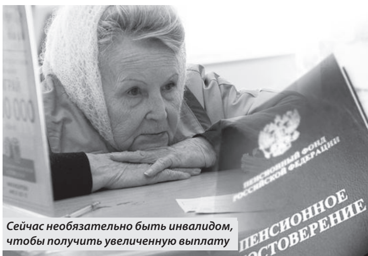
Сейчас необязательно быть инвалидом, чтобы получить увеличенную выплату

Новые государственные инициативы первого летнего месяца 2024 года окажут особенно заметное влияние на социальное обеспечение.