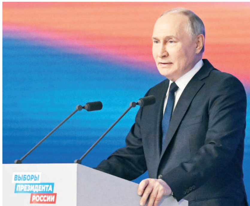
ВЫБОРЫ ПРЕЗИДЕНТА РОССИИ

Президент России поблагодарил доверенных