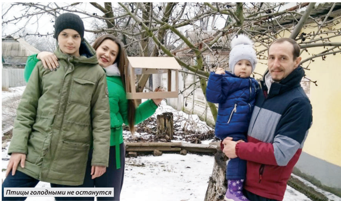
Птицы голодными не останутся

Суть проекта проста. Раз в неделю семьи-участницы получают несложные задания, которые нужно выполнять всей семьей. Среди заданий, например, всем вместе приготовить ужин, сходить в музей или заняться спортом. Затем в социальные сети (VK или Одноклассники) с хештэгом #всейсемьей нужно выложить фотографию, где будет видно, как семья выполнила задание.