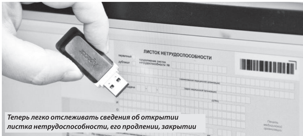
Теперь легко отслеживать сведения об открытии листка нетрудоспособности, его продлении, закрытии

Данные о больничных листах сохраняются в цифровом виде, что снижает объем бумажной работы и вероятность сделать ошибку при заполнении сведений. Работники в свою очередь получают выплаты по нетрудоспособности без обращений и подачи каких-либо документов.