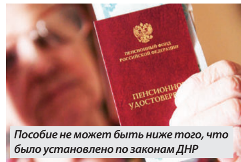
Пособие не может быть ниже того, что было установлено по законам ДНР

Перечисление пенсий в кредитные организации будет осуществляться в три этапа. А именно, если ранее дата выплаты была установлена: