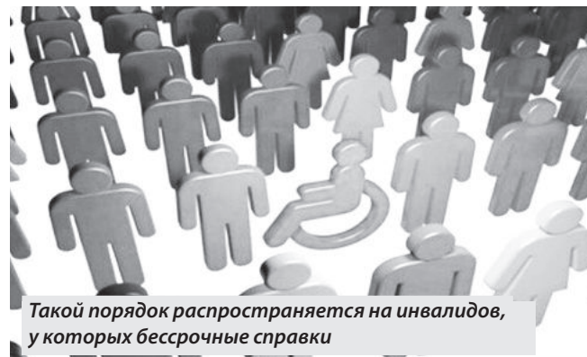
Такой порядок распространяется на инвалидов, у которых бессрочные справки

Так, совершеннолетним гражданам, признанным инвалидами без срока переосвидетельствования до 1 марта 2023 года, а также детям-инвалидам до 18 лет, будет подтверждена ранее установленная группа инвалидности без указания срока переосвидетельствования. В случае ухудшения состояния их здоровья, группа инвалидности будет повышена. Постановлением Правительства РФ разрешено сохранять группу