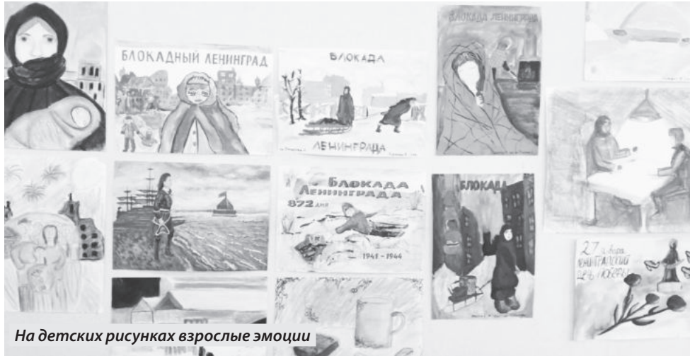
На детских рисунках взрослые эмоции

В ШКОЛАХ ГОРОДА ЕНАКИЕВО ПРОШЛИ МЕРОПРИЯТИЯ, ПОСВЯЩЕННЫЕ ДНЮ ПОЛНОГО ОСВОБОЖДЕНИЯ ЛЕНИНГРАДА ОТ ФАШИСТСКОЙ БЛОКАДЫ