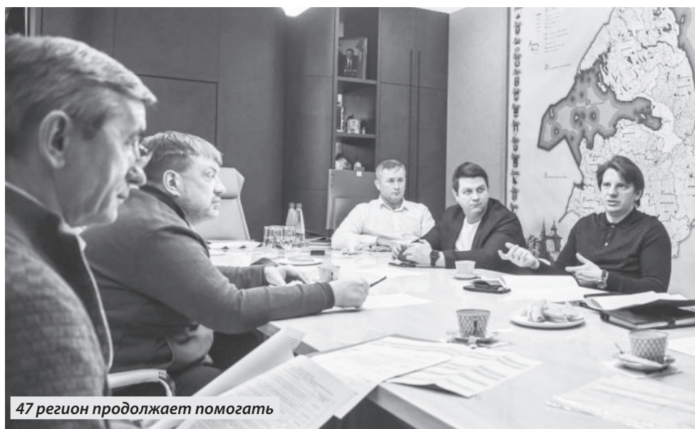
47 регион продолжает помогать

ДЛЯ КАЖДОГО ЧЛЕНА ПРАВИТЕЛЬСТВА ЛЕНИНГРАДСКОЙ ОБЛАСТИ ЕНАКИЕВО СТАЛ ТАКИМ ЖЕ РОДНЫМ КАК КИНГИСЕППСКИЙ ВСЕВОЛОЖСКИЙ ИЛИ ПОДПОРОЖСКИЙ РАЙОН