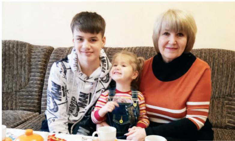
У любимой бабушки и чай вкуснее

Каждый месяц организаторы будут проводить промежуточные розыгрыши подарков для всех участников проекта. В конце марта состоится финальное награждение самых активных семей – их ждут особенные и ценные подарки, например, 100 семейных туров по России от проекта «Больше, чем путешествие» и другие.