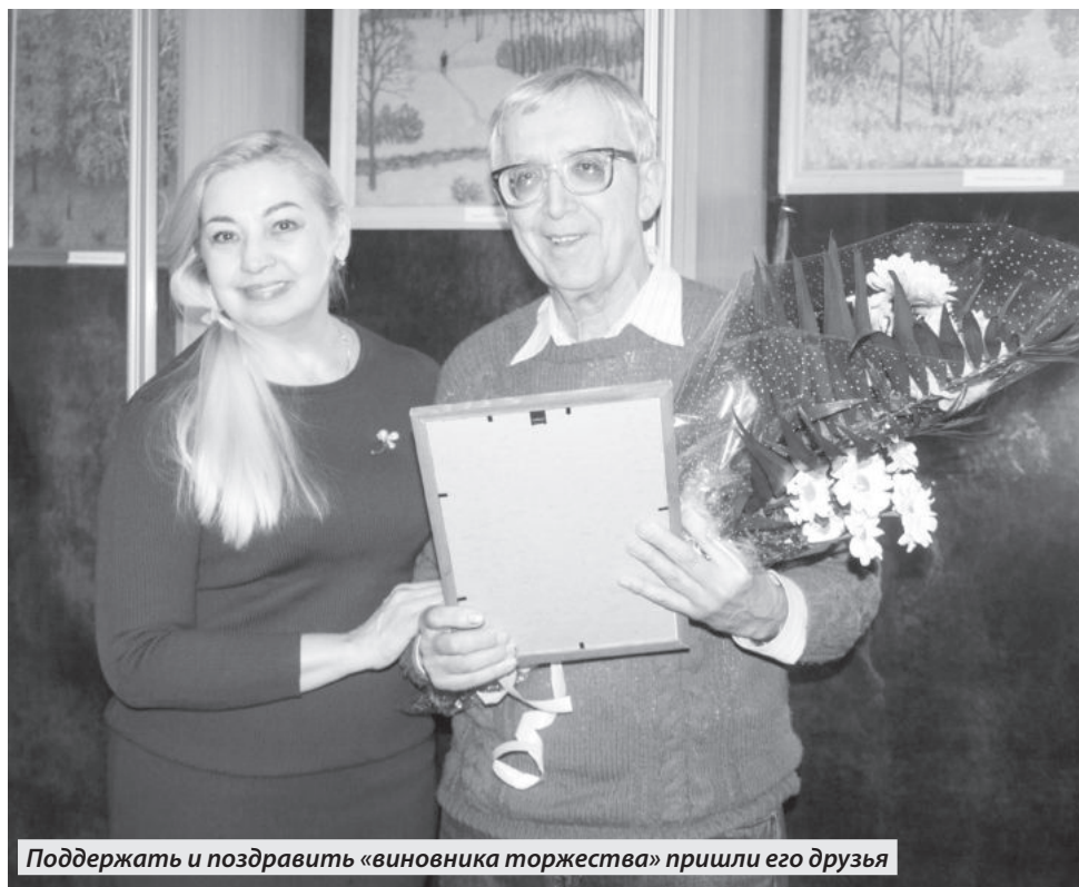
Поддержать и поздравить «виновника торжества» пришли его друзья

Творчество художника отличается инерцией, набравшей темп по количе-