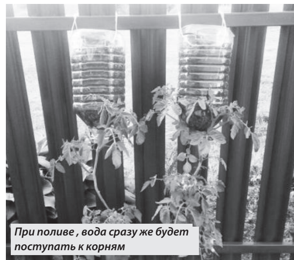
При поливе, вода сразу же будет поступать к корням

А ведь можно просто посадить рассаду помидоров в пластиковые бутылки вверх тормашками. Выгодно, удобно. Возможно, этот способ понравится и в будущем вы будете сажать большую часть помидоров именно так, освободив тем самым место на участке для других культур.