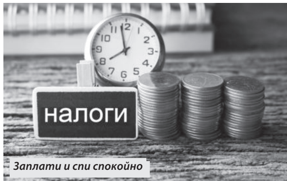
Заплати и спи спокойно

«Личный кабинет налогоплательщика для физических лиц» позволяет не только заполнить онлайн декларацию и направить ее в электронном виде, но и отследить камеральный статус поданной отчетности.