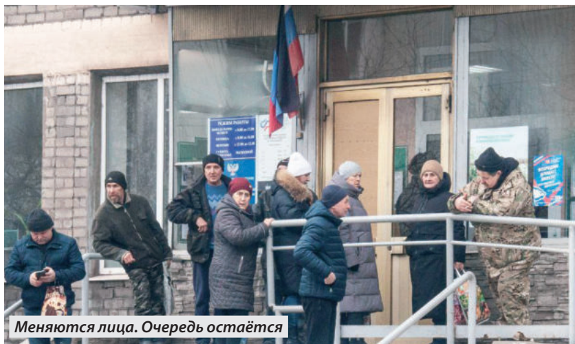
Меняются лица. Очередь остаётся

ПОЧЕМУ НЕВОЗМОЖНО ДОЗВОНИТЬСЯ В ЕНАКИЕВСКОЕ ОТДЕЛЕНИЕ СОЦИАЛЬНОГО ФОНДА РОССИИ?