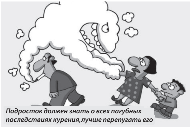
Подросток должен знать о всех пагубных последствиях курения, лучше перепугать его

Прежде всего, не обманывайте, не «прячьтесь» от детей – они разоблачат вас раньше, чем вы думаете. Но и курить демонстративно, «театрально» точно не надо. Согласитесь, если вы сами курите,