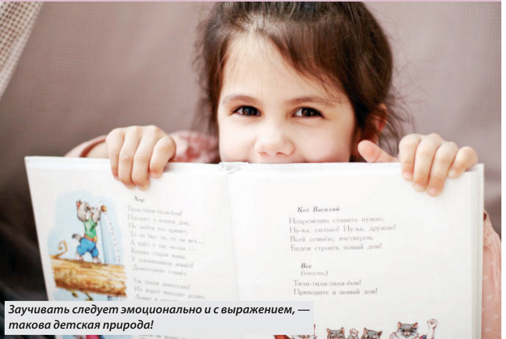
Заучивать следует эмоционально и с выражением, — такова детская природа!

Перед тем как приступать с ребенком к занятиям по лирическому искусству, стоит определиться, когда лучше начинать. Психологи рекомендуют учить стихи с малышом в возрасте от двух лет. Единственный критерий: малыш должен уметь разговаривать и может складывать простые предложения из слов.