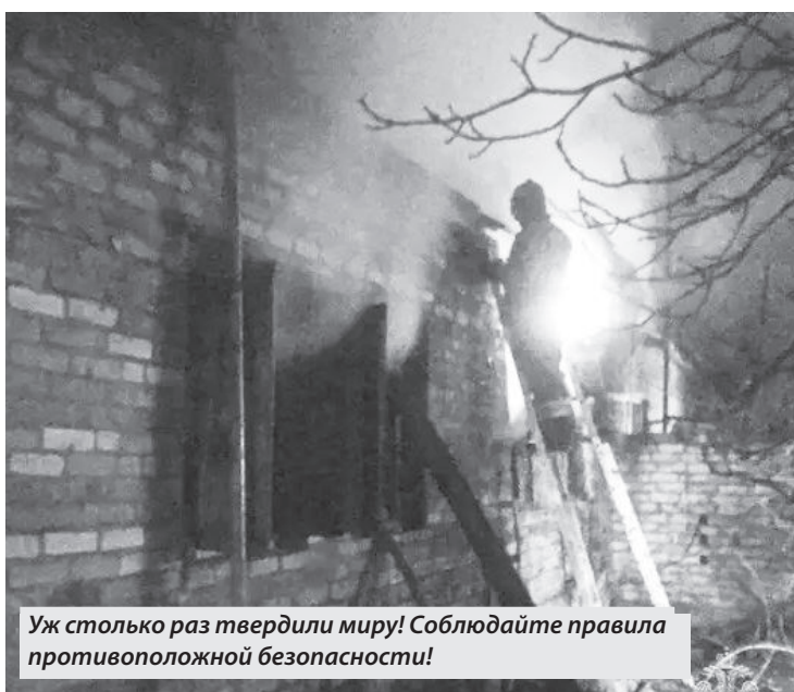
Уж столько раз твердили миру! Соблюдайте правила противопожарной безопасности!

пожилых людей, соседей, особенно тех, кто входит в группу риска: престарелые, имеющие заболевания, злоупотребляющие спиртными напитками.