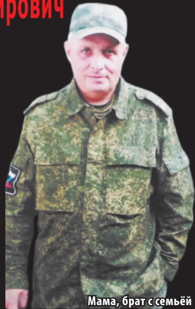
Мама, брат с семьёй

Уже как год нет с нами дорогого, любимого сына, брата. «Твой образ не забыть, Всю боль не выразить словами Мы будем помнить и скорбить... И сожалеть, что ты не с нами».